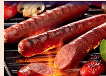
【ビーフソーセージ】