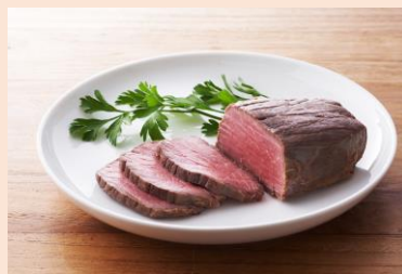
【グラスフェッドロストビーフ】